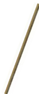
Les baguettes de finition